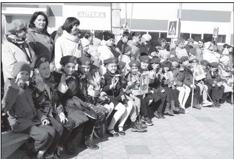
В селе Тогур у мемориала Воинам, погибшим в Великой Отечественной войне, состоялось торжественное возложение цветов